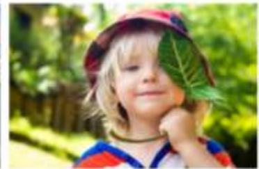
Psykisk helse og livskvalitet