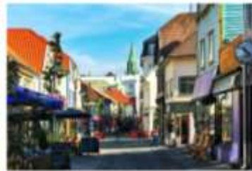
Arkitektur og folkehelse