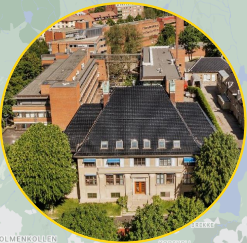
Adamstuen Oslo Kommune