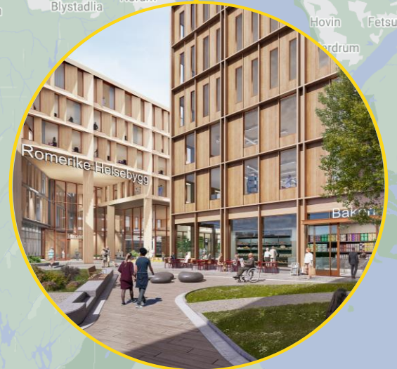
Romerike helsebygg Lillestrøm Kommune