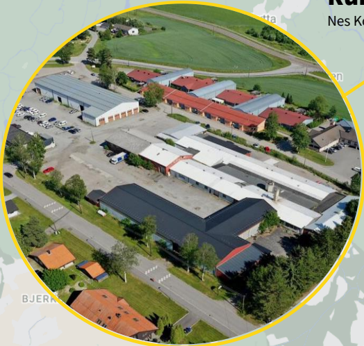
Runni Nes Kommune