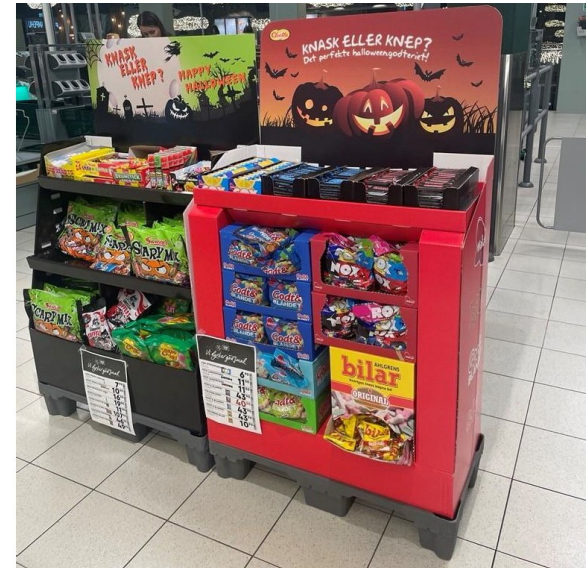
Eksempel på spesialutstilling