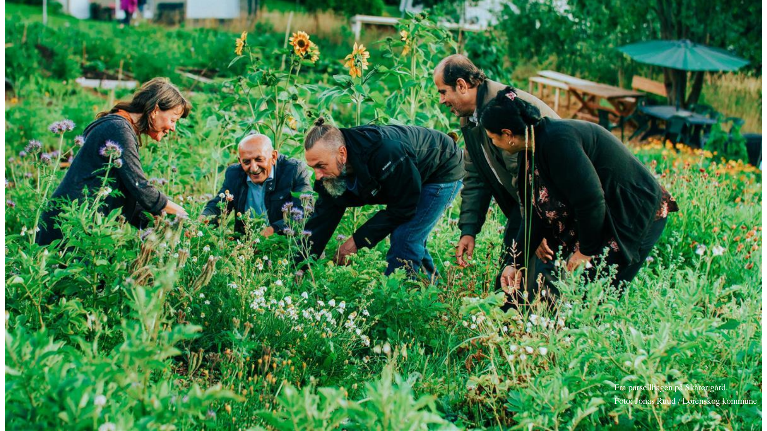
Fra parsellhagen på Skårer gård.