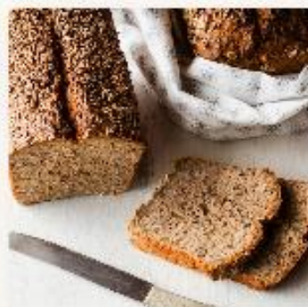
Grovt havregrynbrød - for barnehager