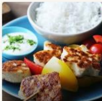
Fiskekaker på spyd - for barnehager