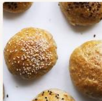
Grove rundstykker (kaldheves over natten) - for barnehager