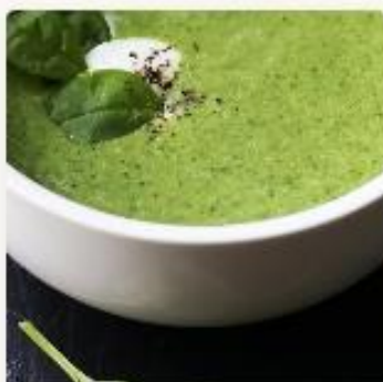
Skippernsuppe - for barnehager