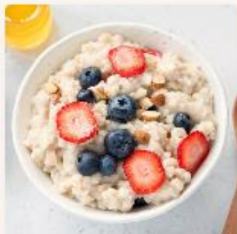
Byggrynsgrot - for barnehager