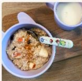
Havregrot - for barnehager