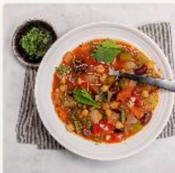
Grønnsakssuppe med kikerter - for barnehager