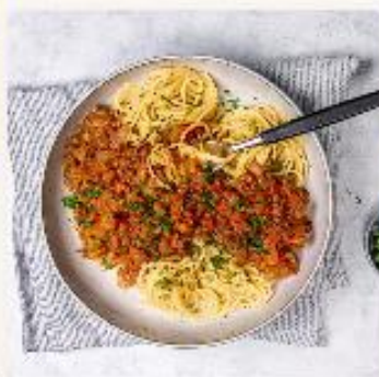
Spaghetti med grønnsaksbolognese - for barnehager