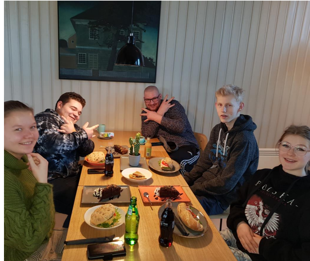
Medvirkningsgruppen – de ekte sjefene!