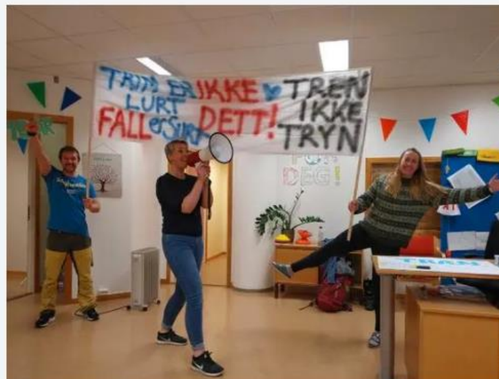
Aktivitetstog til Harstad kommune skal fredag den 13. gå i tog gjennom Harstad for å hindre ulykker.

Fredag 13. mai kan du være med å forebygge ulykker.