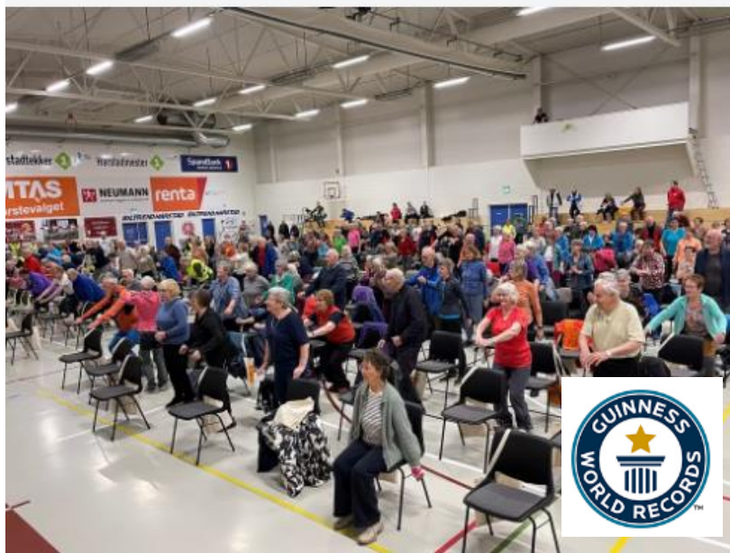
Mange fremmøtte til verdensrekordforsøket i Stangneshallen.

Seniortrening inn i Guinness world record. Onsdag arrangerte Trygge lokalsamfunn og Harstad kommune verdens største seniortrening i Stangneshallen.