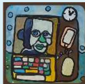
Skjerm og andre medier