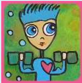
Fysisk og psykisk helse