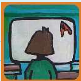
Oppvekst og læring