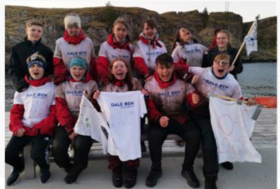
Dale Oen Stiftelsen, 2024

Som igjen har endret deres holdning til livet.