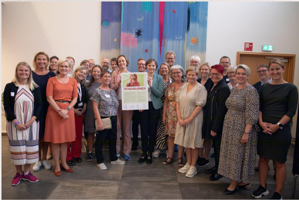
11. august 2022 ble Fritidserklæringen signert på nytt.

For å realisere dette må alle barn ha mulighet til å delta jevnlig i minst én organisert fritidsaktivitet sammen med andre.